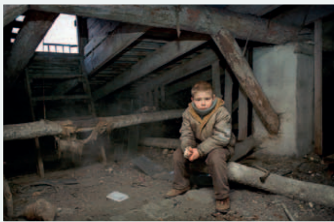
12-årig pojke på vinden där han sover tryckt mot ett vattenledningsrör i Sankt Petersburg. Ute var det -20 grader.