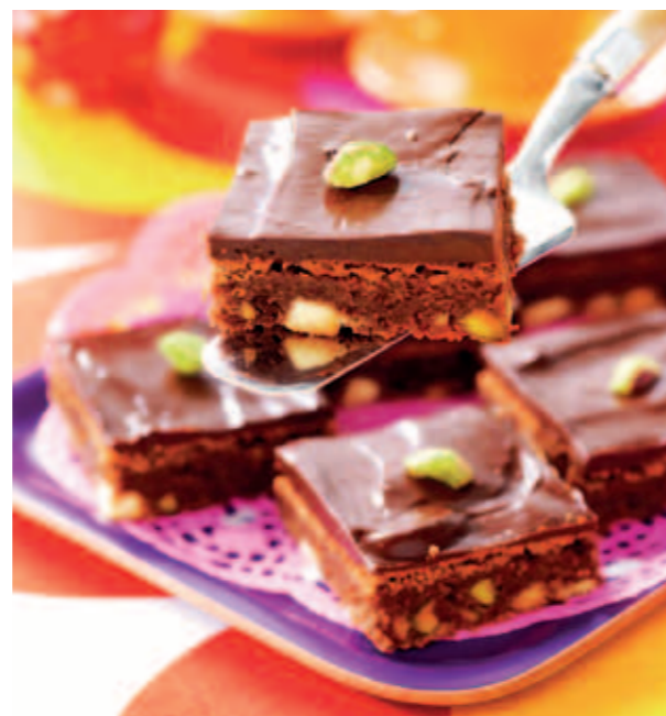
Garnera med pistaschnötter och servera gärna med vispad grädd.