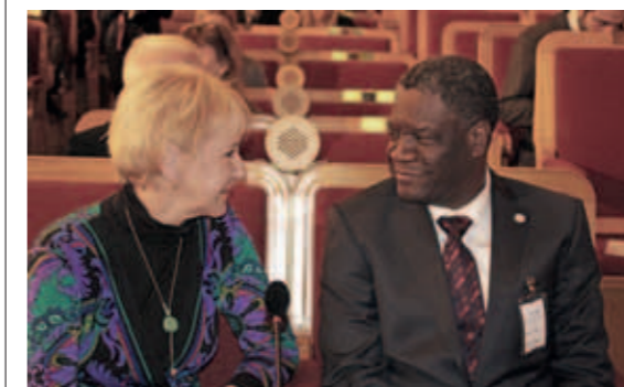
Margot Wallström i samtal med DR Denis Mukwege.