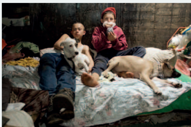
Sniffande barn i kloakerna i Rumänien.