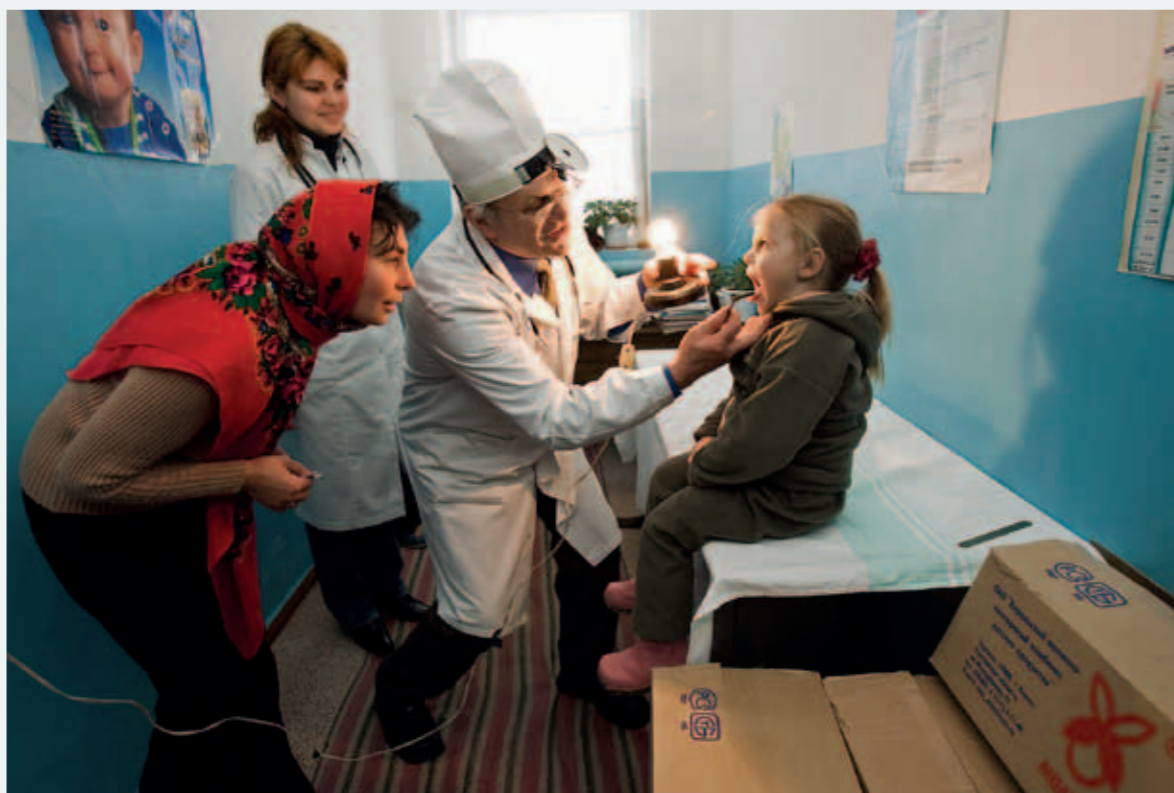
Mobil läkarklinik i Moldavien.

avlost varandra och numera har han svårt att hålla räkningen men gissar att det handlar om minst fyrtio resor till nästan lika många länder.