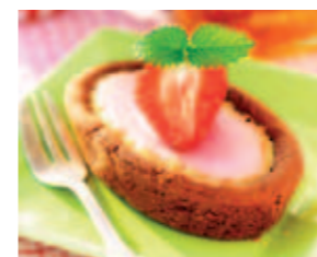
Garnera med jordgubbar och citronmeliss.